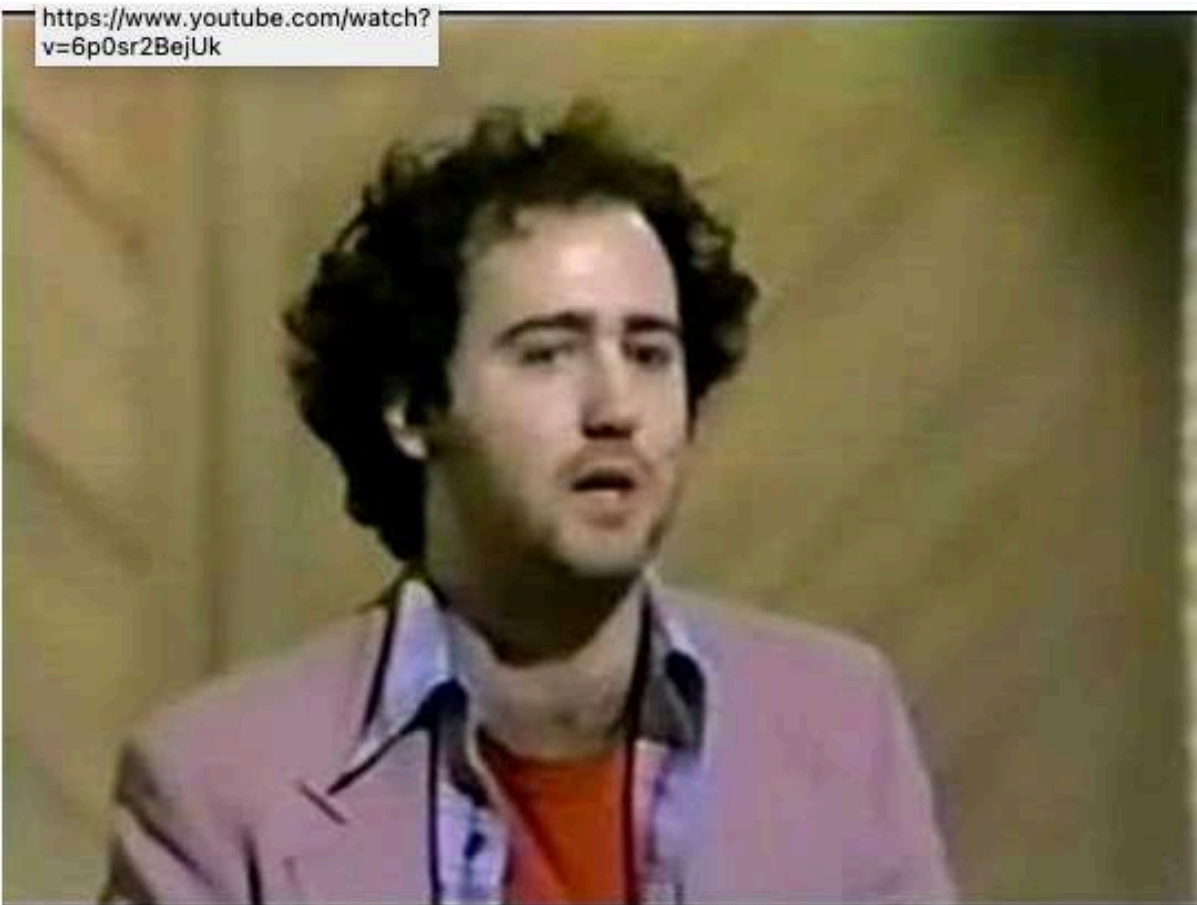
Andy Kaufman on Letterman show (October 15 th 1980)