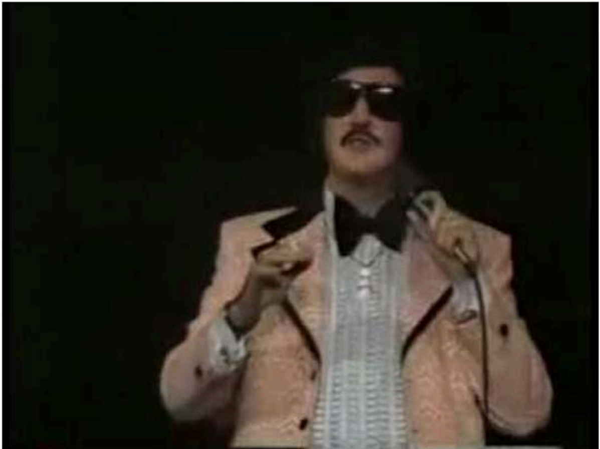
Andy Kaufman Plays Carnegie Hall (1980)